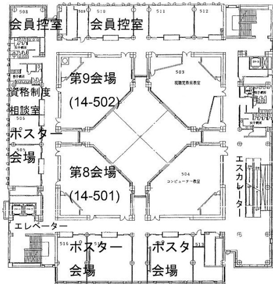
14号館5階 (第8・第9会場、ポスター会場、会員控室)