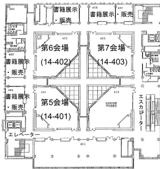
14号館4階 (第5～第7会場、書籍販売)