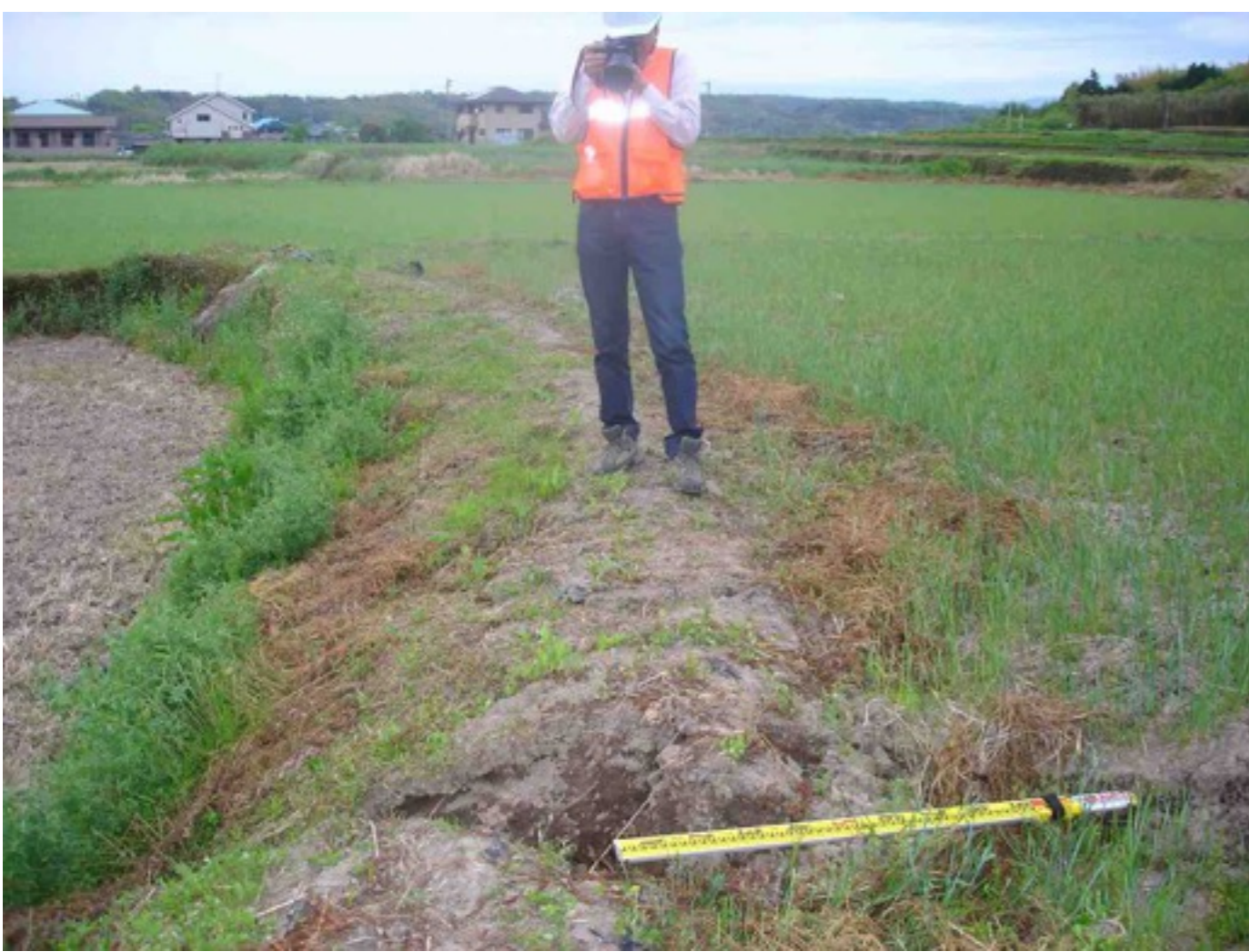
益城町福原の布田川断層において，N99°E，約60~70mの右横ずれの地表地震断層を確認しました。